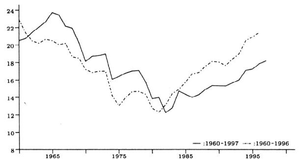
Fig. 3 : Evolution du taux de profit (%) en Europe (pointillés) et Etats-Unis (trait plein).

Les procédures de saisie de logements ont atteint le seuil de 180 000 en juillet 2007 et dépassent la barre du million depuis le début de l'année soit 60% de plus qu'il y a un an. Il devrait y avoir un total de deux millions de procédures de saisie en 2007.